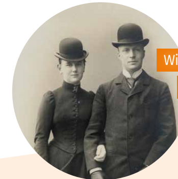
Wilhelmina & Hendrik

De voordelen van de familiale band tussen de Mecklenburgse en Nederlandse dynastie werden ook duidelijk bij de vestiging van de Nederlandse vliegtuigbouwer Anthony Fokker. In 1913 verhuisde hij zijn bedrijf immers naar Schwerin. Vooral de vliegtuigen die gevechtspiloot Manfred von Richthofen hier ontwikkelde en bouwde, werden beroemd. Na het verlies van de Eerste Wereldoorlog kwam er een einde aan de korte periode van vliegtuigbouw in Schwerin. In de Bornhövedstraße staan nog twee voormalige fabrieksgebouwen.