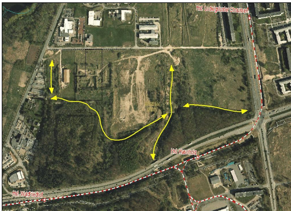
Abb. 2: Schwerpunktmäßige Bewegungskorridore Jagdhabitats der festgestellten Fledermausarten

Darstellung der potenziellen Achsen, auf denen die Fledermäuse ihre Nahrungsflüge schwerpunktmäßig durchführen, ist der nachfolgenden Abbildung 2 zu entnehmen.