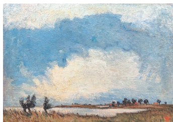
Eckhard Kohrt Boddenlandschaft, Öl auf Hartfaser, um 1980