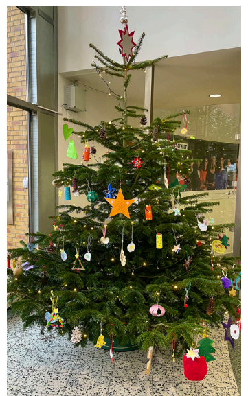
Traditionell schmücken Kitakinder jedes Jahr zur Adventszeit den Weihnachtsbaum im Foyer des Stadthauses.

Zum Abschluss durften die Mädchen und Jungen den Oberbürgermeister in sein Büro begleiten und den Blick über die Stadt genießen.