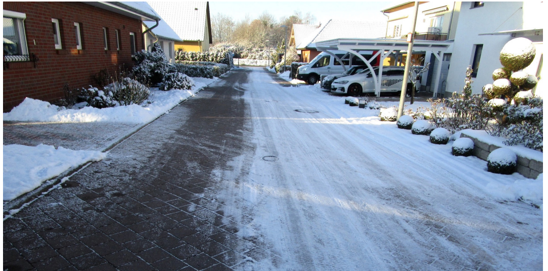
Die linke Seite der Straße ist durch die Anlieger vorbildlich geräumt, rechts wurde der Pflicht zur Räumung noch nicht nachgekommen.

„Viele erfreuen sich an dem Schnee zur Adventszeit. Damit der Gehweg entlang des Grundstücks nicht zur ungewollten Rutschpartie führt, haben Eigentümerinnen und Eigentümer im Sinne des Gemeinwohls dafür Sorge zu tragen, dass niemand zu Schaden kommt,“ informiert Axel Klabe Bereichsleiter Straßenunterhaltung/Abfallwirtschaft vom Eigenbetrieb SDS – Stadtwirtschaftliche Dienstleistungen Schwerin. Geregelt ist das in der Straßenreinigungssatzung. Demnach müssen Anlieger die angrenzenden öffentlichen Flächen zwischen 7 und 20 Uhr freihalten. Nach 20 Uhr entstehende Glätte und Schnee sind bis 7 Uhr des Folgetages zu beseitigen. Diese Flächen sind Gehwege, angrenzende Radwege oder begehbarer Seitenstreifen. Grundsätzlich ist hier mindestens auf einer Breite von 1,50 Metern zu räumen. Die Sondersituation in verkehrsberuhigten Straßen ist vielen nicht bewusst, hier gilt es die