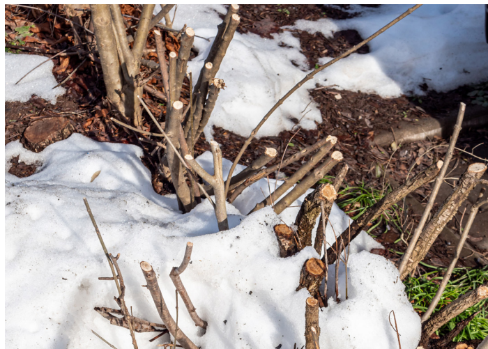
Stark überalterte Heckenabschnitte sollen in Lankow und Wickendorf „auf den Stock gesetzt“ werden.

Rückfragen richten interessierte Bürger gern an den Fachdienst Umwelt unter der Telefonnummer 0385 545-2452.